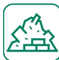
DÉBLAIS / GRAVATS

Des conteneurs à emballages sont présents dans la déchèterie ou à proximité. Vous pouvez y déposer en vrac : les bouteilles et flacons en plastique, tous les emballages plastiques (pots yaourt, sachets, barquettes,...), ..., les cartonnettes, les briques alimentaires, et les emballages métalliques.