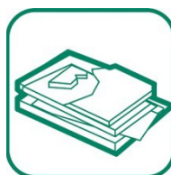
PLÂTRE ET PLAQUES DE PLÂTRE

Ne sont pas acceptés : plâtre (benne à placo), amiante/fibrociment (société spécialisée), plastique (benne à plastique ou encombrants).