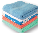
Linge de maison